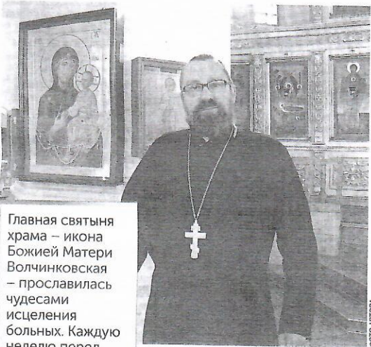
Главная святыня храма — икона Божией Матери Волчинковская — прославилась чудесами исцеления больных. Каждую неделю перед ней совершается молебен.

Прихожане видят добрый знак в том, что уже несколько лет подряд на высохшем дереве на территории храма ведутся аисты. Ныне в гнезде подрастают три красивых птенца. Добрый знак и в том, что в этом году в храме провели семь Таинств Крещения. Церковная община прихода маленькая, но крепка своей верой, а люди тянутся в Мурованку за духовным светом отовсюду. И каждый человек находит здесь то, что ищет: веру, надежду и милость Божию.